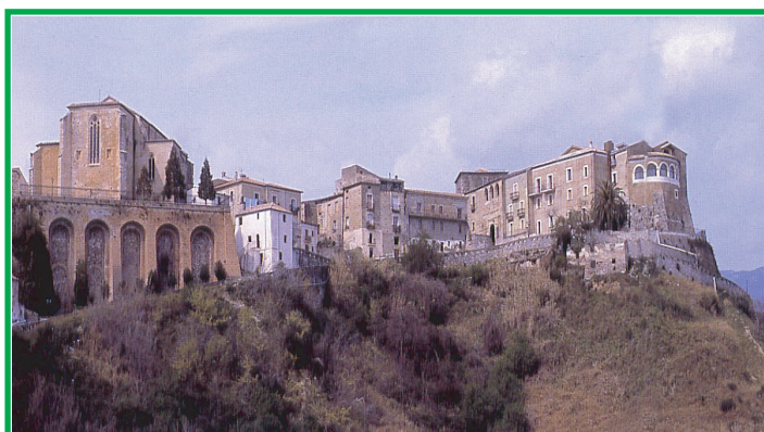
Castello di Altomonte