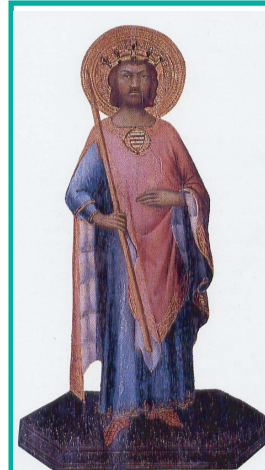
Simone Martini - San Ladislao -

Realizzato dall' Agriturismo "Le Farnie" - C.da S. Anna - 87042 Altomonte (CS)